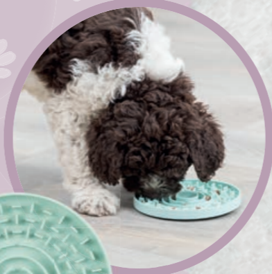
Schleckplatte #34954/34958 UVP ab 3,99 €