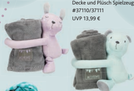
Kuschel-Set Decke und Plüsch Spielzeug #37110/37111 UVP 13,99 €