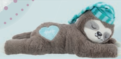
Faultier Heartbeat mit Herzschlag #36166 UVP 24,99 €