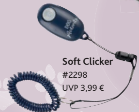
Soft Clicker #2298 UVP 3,99 €