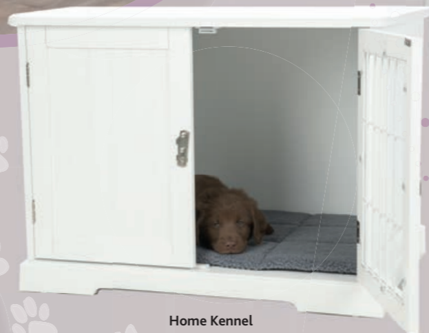
Home Kennel #39751/39753 UVP ab 109 €