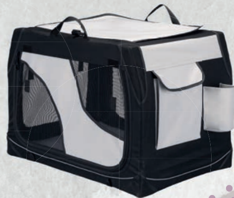
Mobile Kennel Vario #39721-39724 UVP ab 89,99 €

Verlängere schrittweise die Zeitspanne, in der der Welpen allein im Kennel bleibt. So kannst du Kleinigkeiten schnell und in Ruhe erledigen, während dein Welpen sicher untergebracht ist.