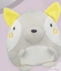
Plüsch-Fuchs #36165 UVP 9,99 €