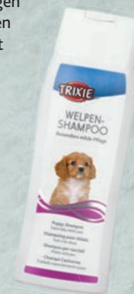
Welpen-Shampoo #2906/2916 UVP ab 3,99 €

Tipp: Trainiere das Zeigen der Zähne und Ohren gleich mit. Das zahlt sich spätestens beim nächsten Tierarztbesuch aus.