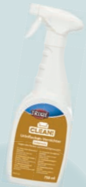
Urinflecken- Vernichter #25751 UVP 7,99 €