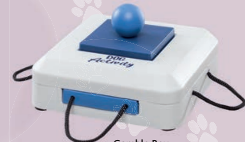
Gamble Box #32011 UVP 9,99 €

Das Dog Activity Sortiment umfasst zahlreiche weitere Strategiespiele mit verschiedenen Schwierigkeitsgraden.