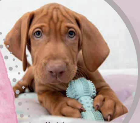
Hantel #33343 UVP 5,49 €

Mit Wasser vollsaugen, einfrieren, erfrischen! Ideal beim Zahnwechsel.