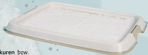
Hundetoilette Nappy Loo #23415/23416 UVP ab 12,99 €