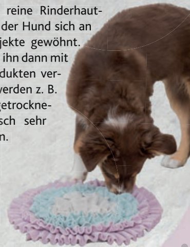
Schnüffelteppich #32039 UVP 19,99 €

Wähle zunächst reine Rinderhaut-Produkte, damit der Hund sich an diese als Kauobjekte gewöhnt. Später kannst du ihn dann mit verfeinerten Produkten verwöhnen. Meist werden z. B. Kauartikel mit getrocknetem Hühnerfleisch sehr gut angenommen.