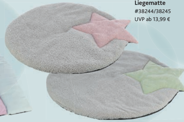
Liegematte #38244/38245 UVP ab 13,99 €