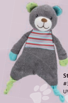
Stoffbär #36176 UVP 8,99 €