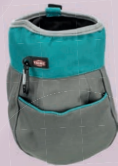
Snack-Tasche #32281 UVP 9,99 €