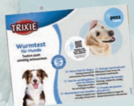
Wurmtest für Hunde #24202 UVP 37,99 €