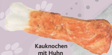
Kauknochen mit Huhn #31343-31345 UVP ab 3,49 €