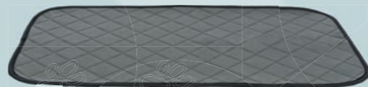
Hygiene-Unterlage Nappy Wash #23420-23422 UVP ab 12,99 €