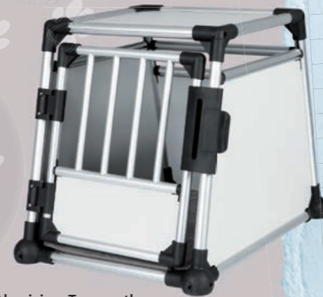
Aluminium-Transportbox #39340-39346 UVP ab 189,00 €