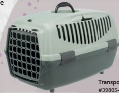
Transportbox Capri #39805-39807 UVP ab 17,99 €