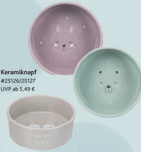
Keramiknapf #25126/25127 UVP ab 5,49 €