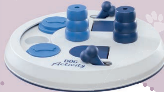
Flip Board #32026 UVP 9,99 €

Das Dog Activity Sortiment umfasst zahlreiche weitere Strategiespiele mit verschiedenen Schwierigkeitsgraden.