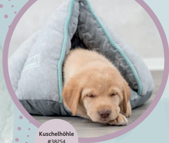
Kuschelhöhle #38254 UVP 29,99 €

Aber auch andere Vorbereitungen können frühzeitig getroffen werden: Informiere dich z. B. über eine passende Tierhalterhaftpflicht, kümmere dich um die Anmeldung zur Hundesteuer und halte Ausschau nach einer Welpengruppe, die zu dir passt.