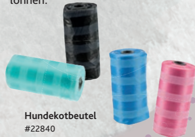
Hundekotbeutel #22840 UVP 2,99 €/4 Rollen

Bei großwüchsigen Rassen ist es wichtig, während des Wachstums die Gelenke zu schonen. So sollten z. B. Sprünge aus dem Auto möglichst vermieden werden. Wenn du viel mit dem Wagen unterwegs bist, kann sich die Anschaffung einer Rampe lohnen.