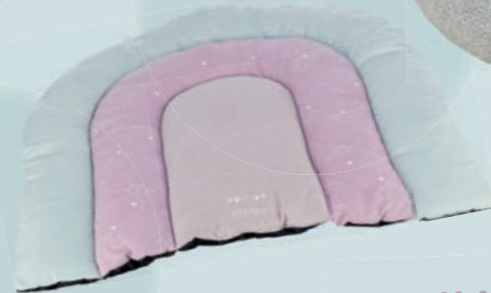
Patchwork Liegematte #38247 UVP 24,99 €