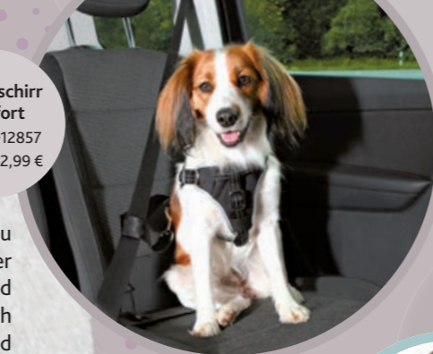
Autogeschirr Comfort #12855-12857 UVP ab 32,99 €