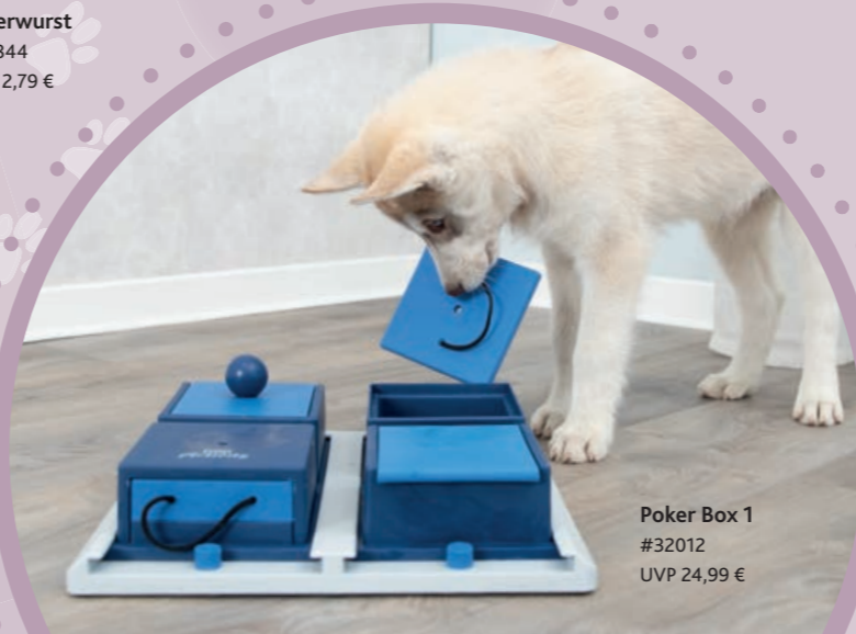
Poker Box 1 #32012 UVP 24,99 €