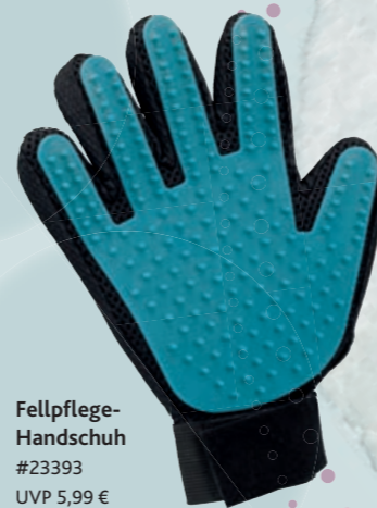
Fellpflege- Handschuh #23393 UVP 5,99 €