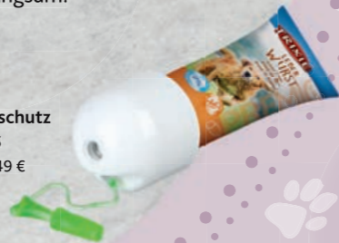
Tubenschutz #24555 UVP 3,49 €

Dog Activity Strategiespiele sind eine spannende Abwechslung und bieten deinem kleinen Freund erste Herausforderungen in Sachen Gedächtnissport und Geschick. Hier gibt es viele verschiedene Möglichkeiten, Leckerlis zu verstecken, an die der Hund durch ziehen, schieben oder heben gelangen muss. Damit kein Frust aufkommt, mache es dem Welpen zu Beginn möglichst leicht und steigere die Schwierigkeit erst langsam.