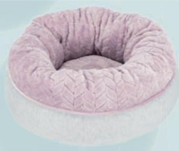
Bett #38251 UVP 24,99 €

Heimweh: In den ersten Nächten wird dein Welpen seine Mutter und die Geschwister sehr vermissen. Stelle den Schlafplatz daher neben dein eigenes Bett. Die Nähe zu dir als neue Bezugsperson wird dem Welpen guttun und das Vertrauen zu dir stärken. Zusätzlich bringt eine Decke oder ein Spielzeug, das schon mit der Hundefamilie gemeinsam genutzt wurde, ein bisschen Geborgenheit mit ins neue Heim. Eine weitere Option ist ein Plüschtier mit integrierter Heartbeat-Funktion. Das Junior Faultier z.B. besitzt ein vibrierendes Herz, welches den Herzschlag der Mutter simuliert und somit dafür sorgt, dass die/der Kleine sich beim Einschlafen nicht alleine fühlt.