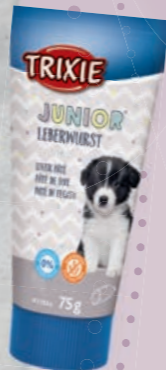
Leberwurst #31844 UVP 2,79 €