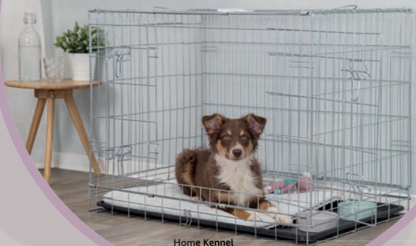
Home Kennel #3922-3926 UVP ab 49,99 €